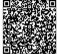
Photo non contractuelle