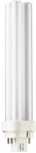
G24Q2 PLC 18w /827 4 pins SPL