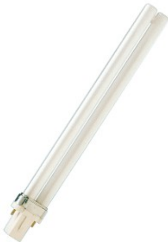
G23 PLS 5w /830 2 pins