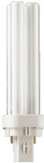
G24D1 PLC 10w /865 2 pins