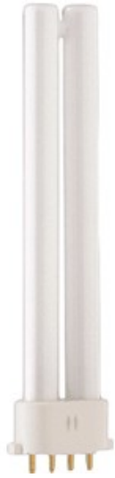
2G7 PLS 7w /827 4 pins SPL