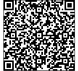
Photo non contractuelle