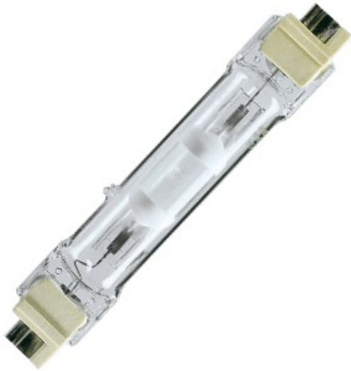
FC2 IM 250w /830 3000K