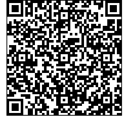
Photo non contractuelle