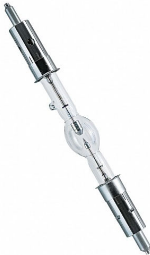
UXL- 450SP Ushio