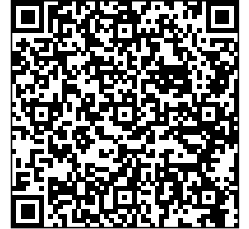
Photo non contractuelle