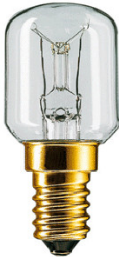
E14 Poirette 26X54 12V 15w