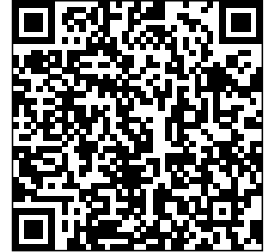
Photo non contractuelle