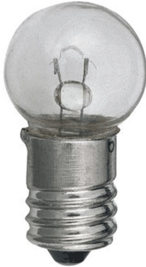
E10 Ballon 6V 5W 15x28mm