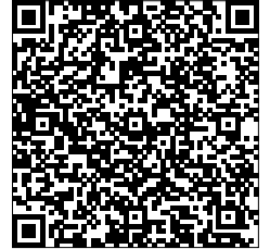
Photo non contractuelle

Douille G13 à clipser 250v 2A + support starter (Avec ressort)